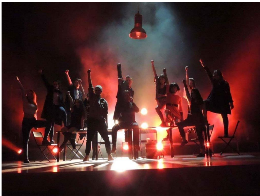
Rent el musical

Técnico de sala como técnico de iluminación en el auditorio Pilar Bardem de Rivas desde 2016