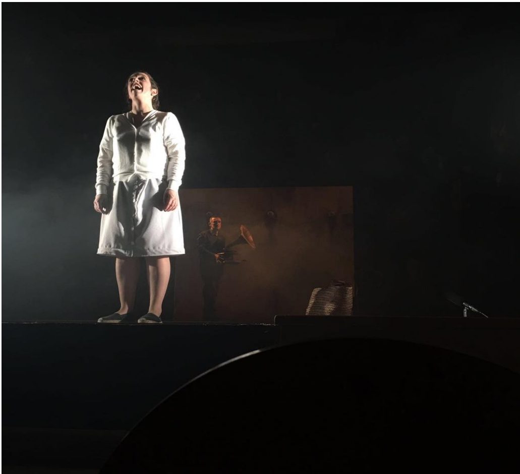
¡Ay Carmela! Mon Teatro